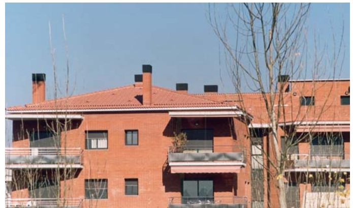
Estético y uniforme diseño en todas las viviendas