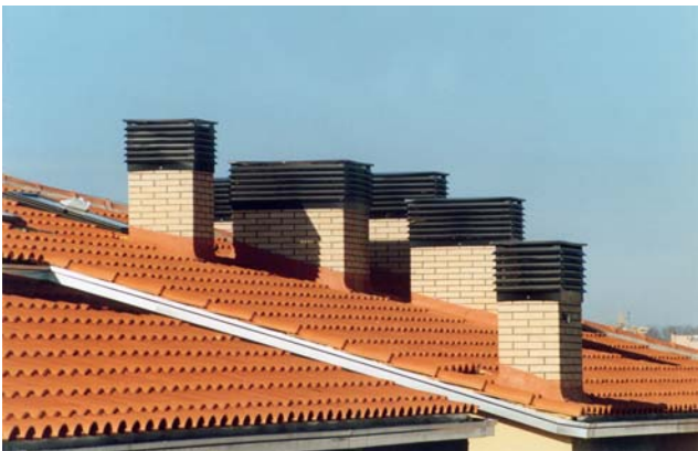
Perfecta integración arquitectónica